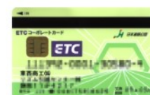
ETCコーポレートカード