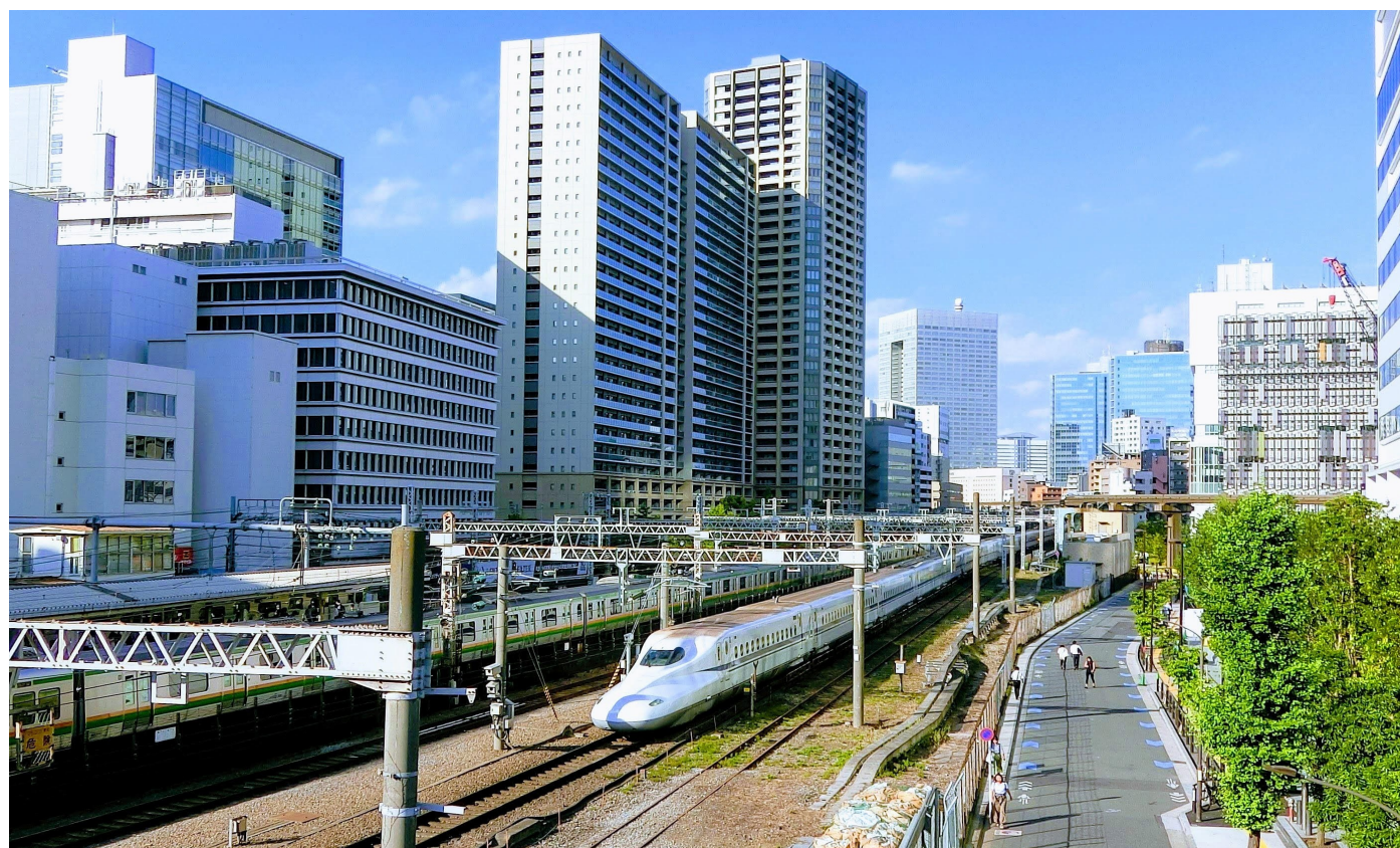
東京都・田町駅