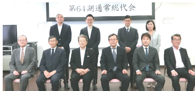
新旧役員で記念撮影

事業を取り巻く環境は目まぐるしく変わる中、ご支援、ご協力いただきました組合員各位に深く感謝申し上げます。』