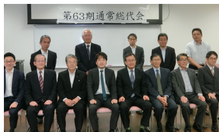
理事・監事・組合職員にて

特定技能支援事業においては、発足2年目の本年度は既存実習生受入れ企業を中心に積極的対応により是非とも実績をつけていく計画としています。