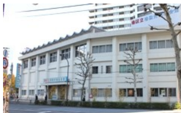
東京都港区港福祉会館

戦後最大の不況が迫ると予想される中、働き方改革・生活様式の変革が迫られているところです。