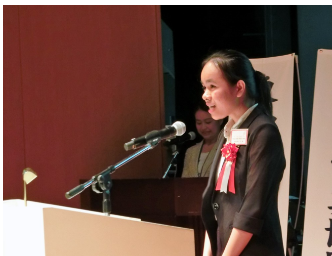
壇上で元気に発表するニーさん