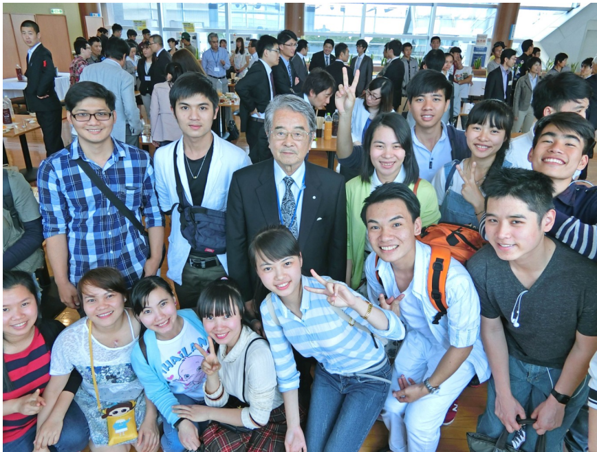
大会後の交流会にて弊組合会長を囲む実習生たち

全国ビジネスサポート協同組合連合会（NBCC）主催の外国人技能実習生日本語弁論大会東京大会が5月29日に日本科学未来館に於いて盛大に開催されました。