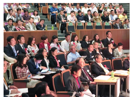
熱気に包まれる会場内