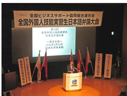
来賓の方々からご挨拶

弁論大会終了後は、眺望の良いレストラン・シーガルに移動して交流会を開き、食事をしながら日頃のコミュニケーション不足を解消しました。特にくじ引きでは素晴らしい景品に実習生たちは大変喜んで、大いに盛り上がりました。