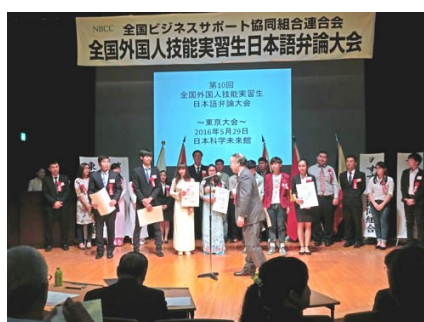
壇上で表彰される入賞者の皆さん