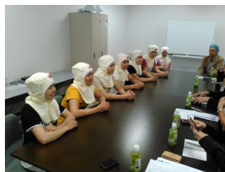
元気に実習を再開した実習生たち

フラも復旧し、工場が操業を再開した今もなお、余震の続く中、受入れ企業様では、震災後の実習生のこころのケアなどに配慮していただき、弊組合としても訪問回数を増やすなどして実習生たちの様子を見守っています。幸い現在は体調を悪くする人もなく、皆元気に実習を行っていることをご報告いたします。