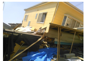
工場周辺では大きな被害が出ました