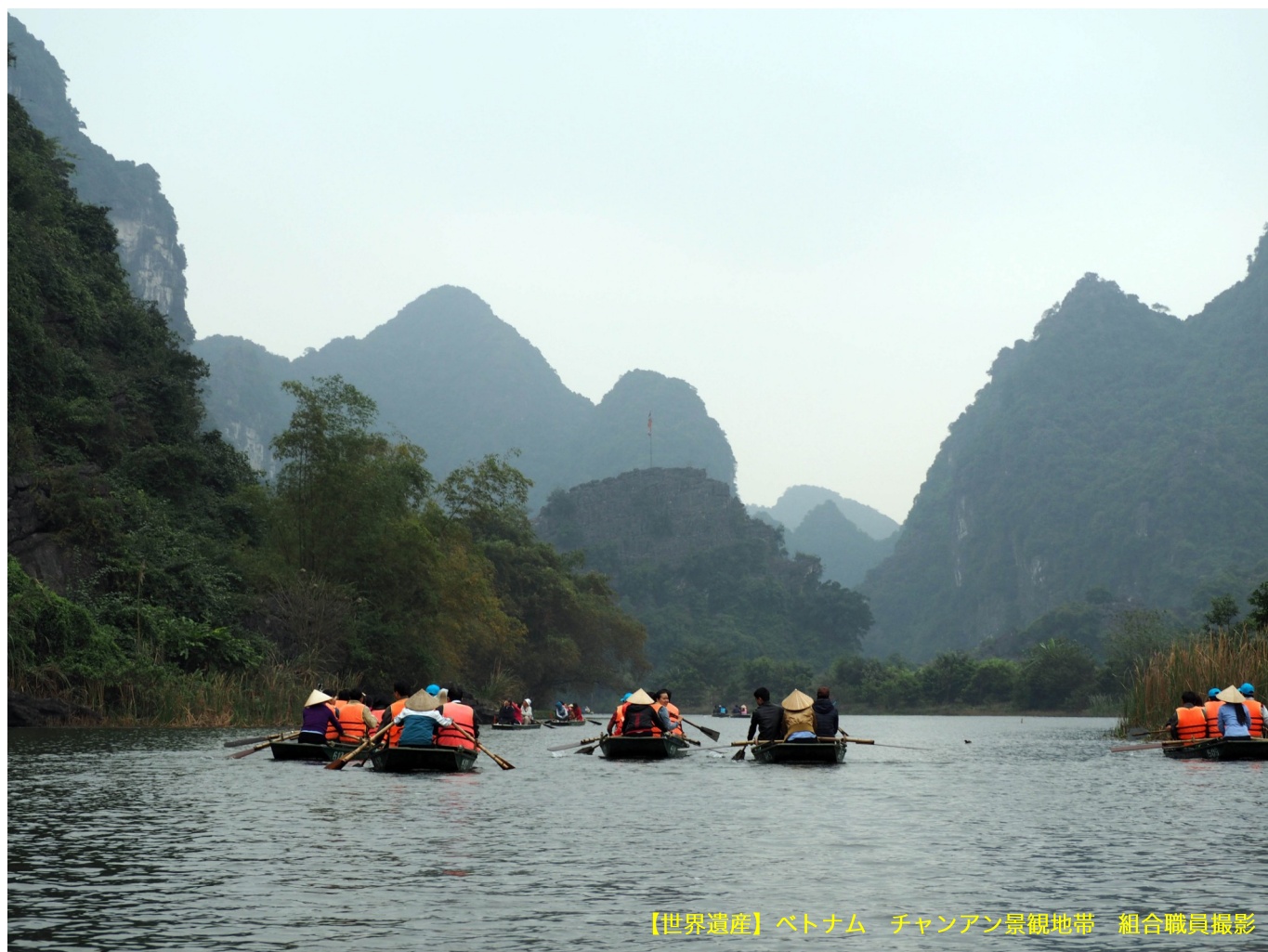
【世界遺産】ベトナム チャンアン景観地帯